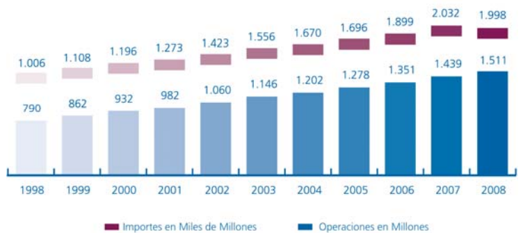
RESUMEN DE EVOLUCIÓN DE OPERACIONES e IMPORTES